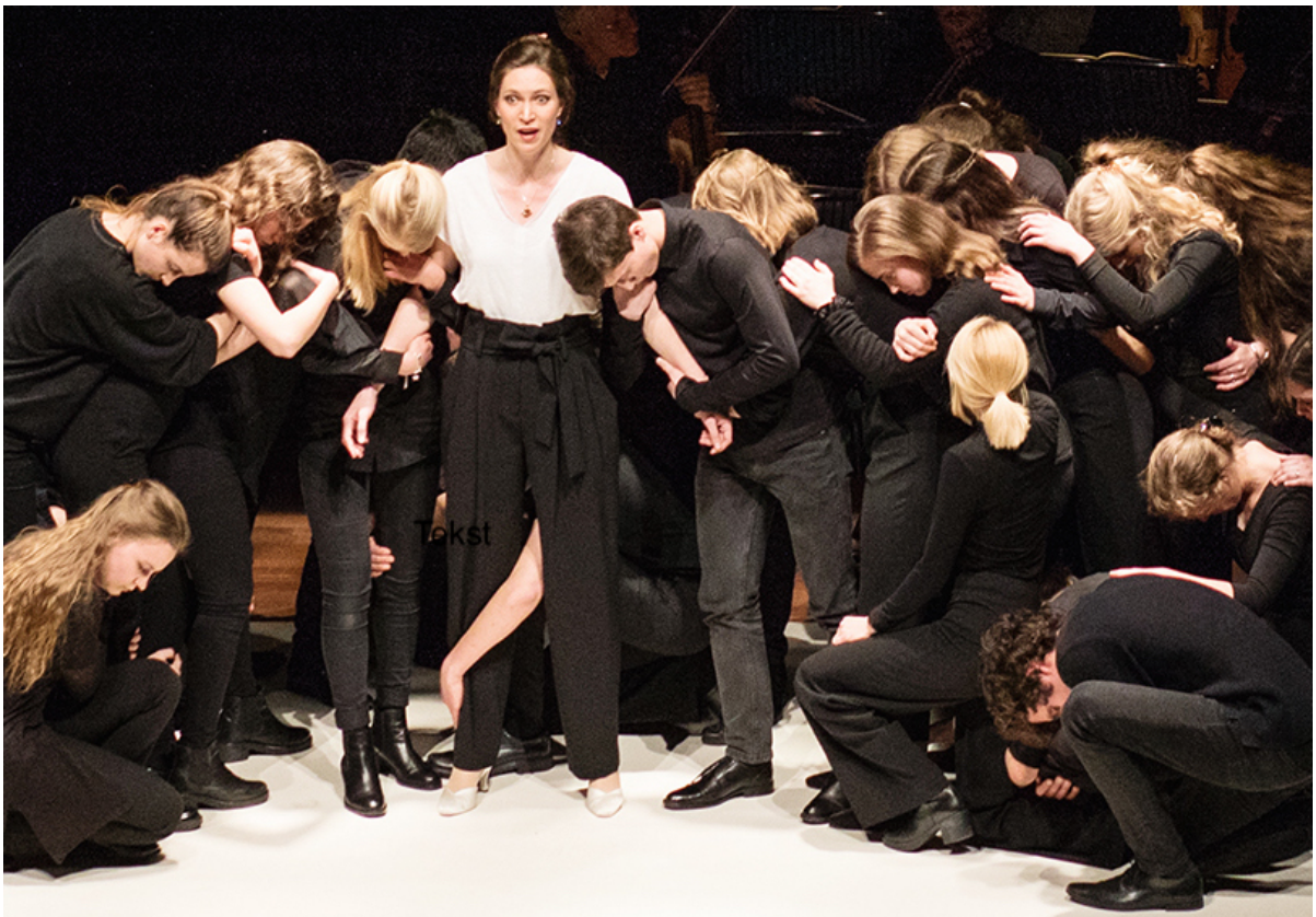
Nationaal Gemengd Jeugdkoor - Johannes Passion - J.S. Bach Regie : Peter Leung Maart 2019

Incidentele activiteiten en projecten zijn niet in de meerjarenbegroting opgenomen en worden pas uitgevoerd als het financiële risico voldoende is afgedekt. Subsidies die niet definitief zijn toegekend worden nog niet als baten opgenomen.