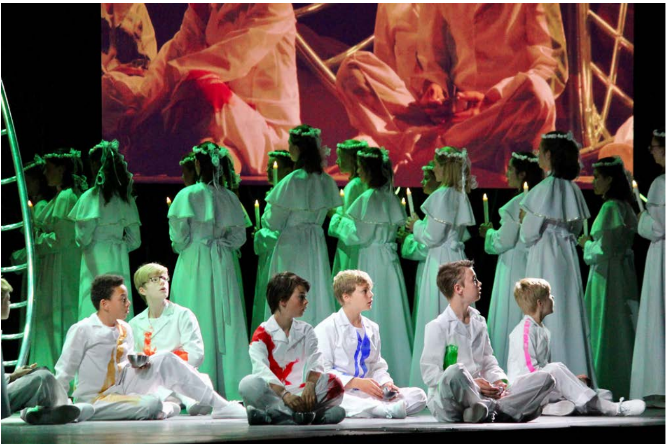
VTN zangers (Nationaal Jongenskoor en Nationaal Vrouwenkoor) in Aus Licht - Stockhausen 2019.

We zetten onze core business met de lesplaatsen, de koren en het aanbieden van podiumervaring onverkort voort. De groei van het aantal leerlingen blijft van belang als er voldoende talenten worden gescout, maar daarnaast richten we ons sterker op uitbreiding/versterking van de organisatie en verbreden we het aanbod voor zangers.